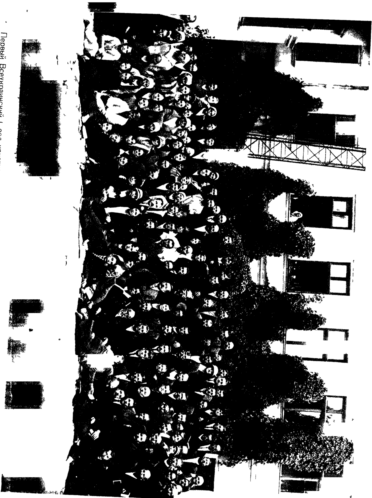
Первый Всеукраинский съезд христиан евангельской веры, состоявшийся в г. Одессе с 21 по 23 сентября 1926 г.