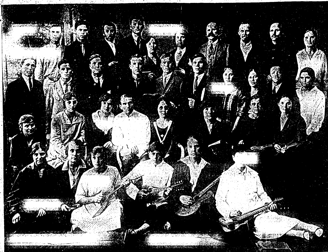
Хор Одесской Общины Х. Е. В.